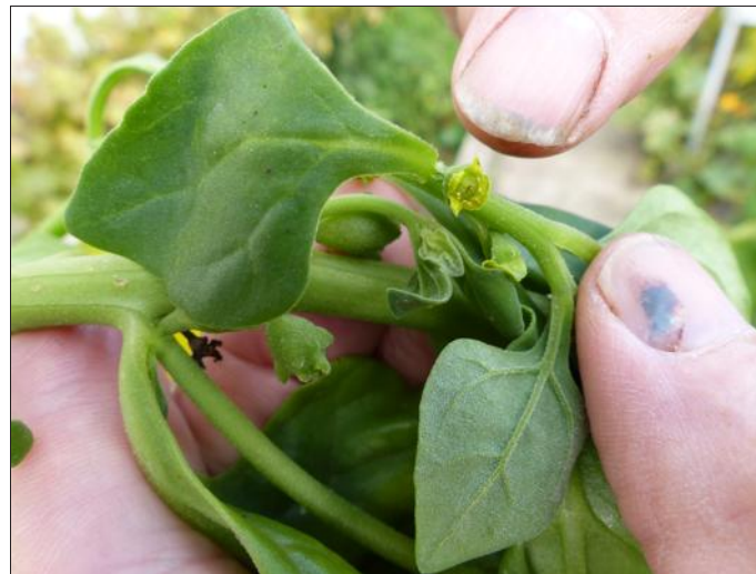
► Des feuilles triangulaires à la base desquelles apparaissent les fleurs et de nouvelles ramifications de la tige principale.

La tétragone, qu'on a bien du mal à trouver sur les marchés et encore plus en grande surface, ne présente pas ces inconvénients. « Les semis s'effectuent en avril. On creuse des trous de 15 cm par 15 qu'on remplit d'un bon terreau bien décomposé. Au milieu de chacun de ces petits carrés, on dispose trois graines, enfouies à 1,5 cm de profondeur. Chaque carré sera espacé de 1 m. » Trois semaines sont nécessaires pour que la plante lève. « On veillera alors à ne conserver que le plus beau pied. La pratique dit que quatre suffisent pour nourrir une famille de quatre personnes pendant un