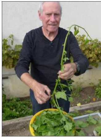
► Des tiges qui peuvent mesurer jusqu'à trois mètres de long !

dispositif de prévention des collisions avec les grands cétacés. Ces collisions sont considérées comme l'une des principales causes de mortalité non naturelle des rorquals communs et des cachalots en Méditerranée. De 16 à 20 % des baleines retrouvées mortes ont été tuées suite à une collision et beaucoup d'individus vivants présentent des traces d'accidents. Connecté à un serveur situé à terre, qui centralise les données, le système Repcet fournit une cartographie des alertes et les transmet par satellite aux navires concernés dans le sanctuaire Pelagos pour la protection des mammifères marins, créé en 1999 entre la France, l'Italie et Monaco.