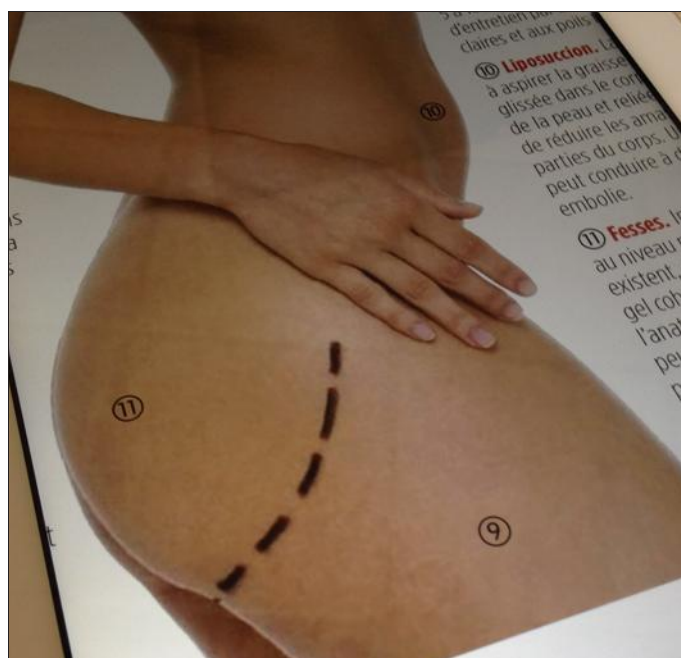
► Dans un dossier consacré à la chirurgie esthétique, le magazine Le Point évoque cette semaine les implants fessiers et les complications de ce type d'intervention désormais répandue.